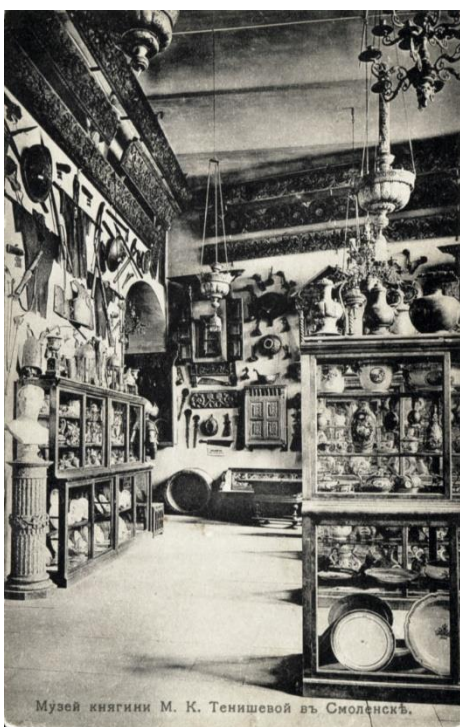
Музей княгини М. К. Тенишевой в Смоленск.

и размещена в здании, ею же построенном. В 1909 году здесь открылся музей «Русская старина». В 1911 году состоялась торжественная передача музея городу Смоленску. После экспонирования коллекции Тенишевой в Лувре в 1907 году парижский журнал «L'art decoratif» писал, что из коллекций