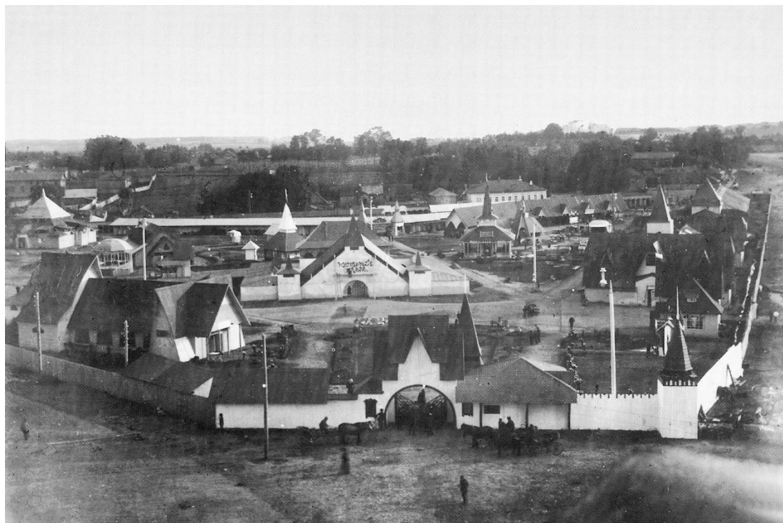
Общий вид выставочных строений на Молоховской площади. Вид с Молоховской башни Смоленской крепости. 1912

Автором проекта всего выставочного комплекса был городской архитектор Николай Васильевич Запутряев (1883–1940). Архитектурный стиль строений можно охарактеризовать как модерн в одной из его вариаций, где обыгрываются элементы древнерусского зодчества.