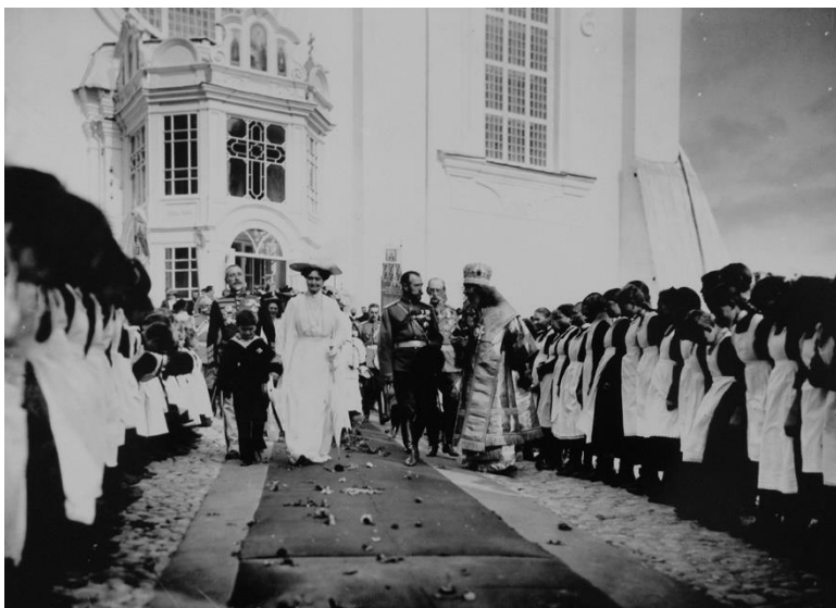
Императорская семья после праздничного молебна в кафедральном Успенском соборе. 1912

приложились к иконе Божией Матери Одигитрии Смоленской. Николай II обратился к председателю совета министров В.Н. Коковцеву с просьбой начислить необходимую сумму для ремонта собора.