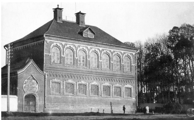
Внешний вид музея «Русская старина». 1910-е

Огромная коллекция предметов, – археологических находок, церковной утвари, предметов этнографии и декоративно-прикладного искусства, – была перевезена Тенишевой из Талашкина в Смоленск