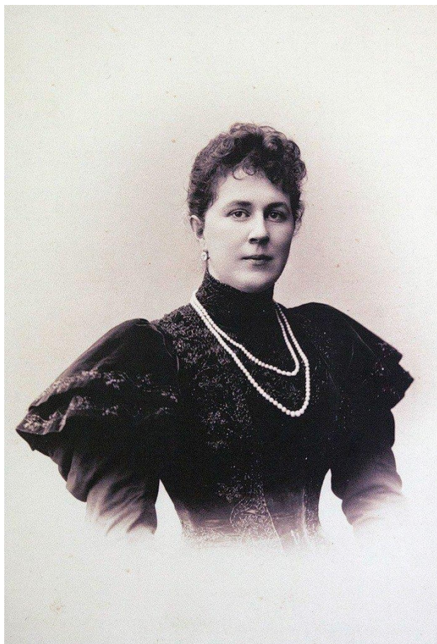
Тенишева М.К. 1890-е

работу по определению представленных на снимках объектов, поскольку известно, что с 1893 года владелицей Талашкина была княгиня М.К. Тенишева (1858–1928).