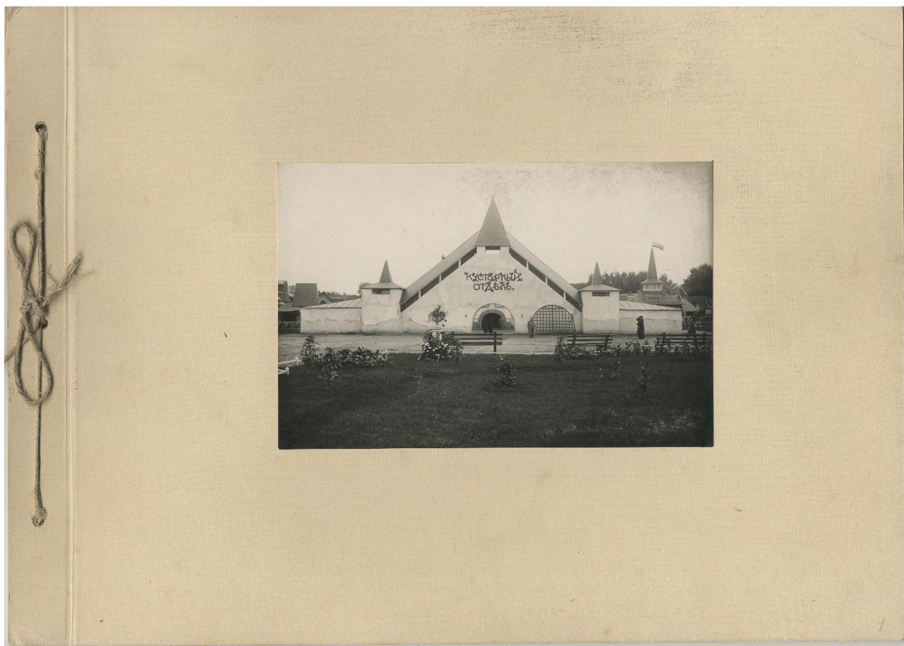
Общий вид альбома

В фондах отдела визуальной информации хранится фотоальбом размером 244 × 340 мм, без обложки, без каких-либо комментариев под снимками. На девяти фотографиях в альбоме представлены выставочные павильоны и фрагменты экспозиции. К счастью, на одной из построек хорошо видна надпись «Кустарный отдел», на другой – «Талашкино», а в экспликациях упоминаются Смоленская и Тверская губернии. Эти сведения позволили начать