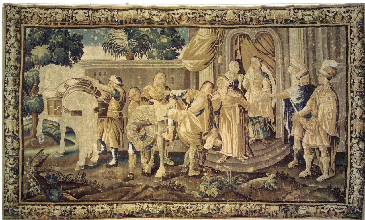
Библейская сцена с отъездом двух всадников (Отъезд блудного сына). Франция, XVII в.

Через несколько лет после описываемых событий я посетила мастерские Chevalier во Франции, где выполняют чистку шпалер и тканей большого размера для крупных мировых музеев и галерей. Там я увидела огромные ванны, в которые с помощью специальных механических устройств погружают шпалеры, уложенные на сетки. Над ванной перемещается трубка с множеством разнообразных душевых головок для подачи фильтрованной деионизированной воды. Реставраторы располагаются в лежачем положении над шпалерой на специальныхдвигающихся платформах, с которых они свешиваются, чтобы тампонировать шпалеру моющим средством. Просушка производится на сетках. В 1980-х такого оборудования в СССР не было. В помещениях музея выполнить эту работу было невозможно.